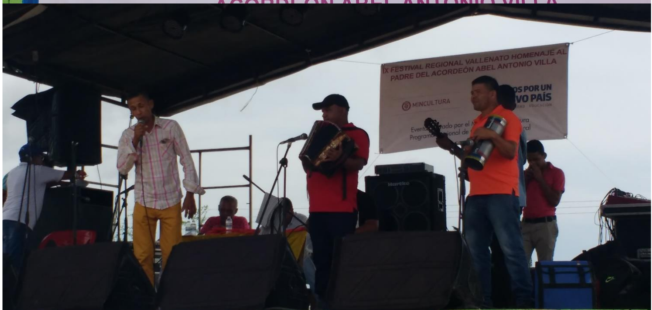
IX FESTIVAL REGIONAL VALLENATO HOMENAJE AL PADRE DEL ACORDEÓN ABEL ANTONIO VILLA